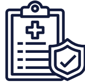
Congé de maladie