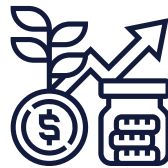
Régime de retraite