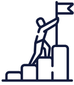
Programme de mentorat