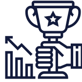
Horaire de jour, du lundi au vendredi