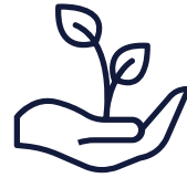
Accès au programme d'aide aux employés