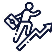
Avancement de carrière