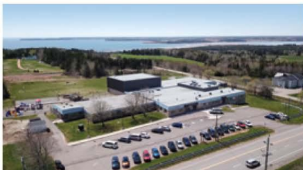
École La Belle-Cloche

La CIF est l'organisme d'accueil et d'établissement des nouveaux arrivants francophones à l'Île-du-Prince-Édouard : tonile.ca/fr